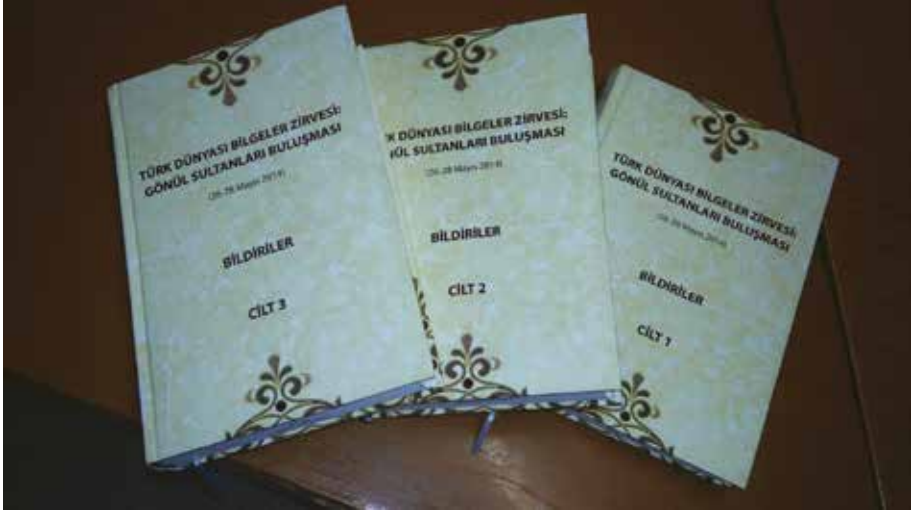
Türk Dünyası Bilgeler Zirvesi: Gönül Sultanları Buluşması (26-28 Mayıs 2014), Türk Dünyası Kültür Ajansı Yayınları, Eskişehir, 2014, III Cilt.

Ebu'l-Hasan Harakani, Yunus Emre, Mevlana Celaleddin Rumi, Hacı Bektaş-ı Veli başta olmak üzere medeniyetimizi aydınlatan şahsiyetlerle ilgili bilgilerin yer aldığı toplantı kitabında; adalet, siyaset ve devlet, ilim, İslam, irfan, kültür, medeniyet, dil ve edebiyat vb. konular, Türk dünyasının bilgelerinin görüşleri çerçevesinde dokuz ayrı bölümde ele alınmıştır.